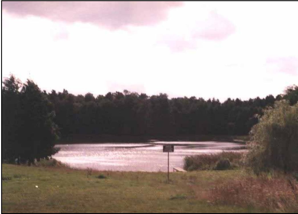
Jezioro Rościmińskie Małe