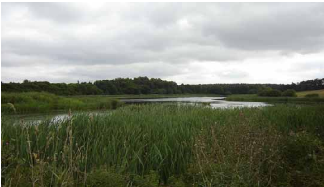
Jezioro Rościmińskie Duże